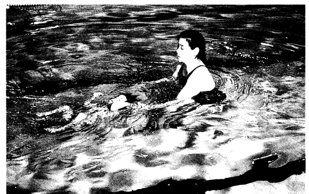
写真3 2歳児背浮きの息継ぎ