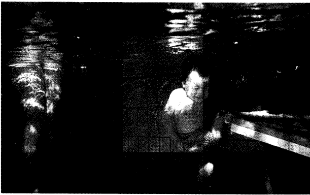
写真4 水中を自由自在に動き回る2歳児